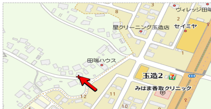
法人本部地図(たまつくりハウス)